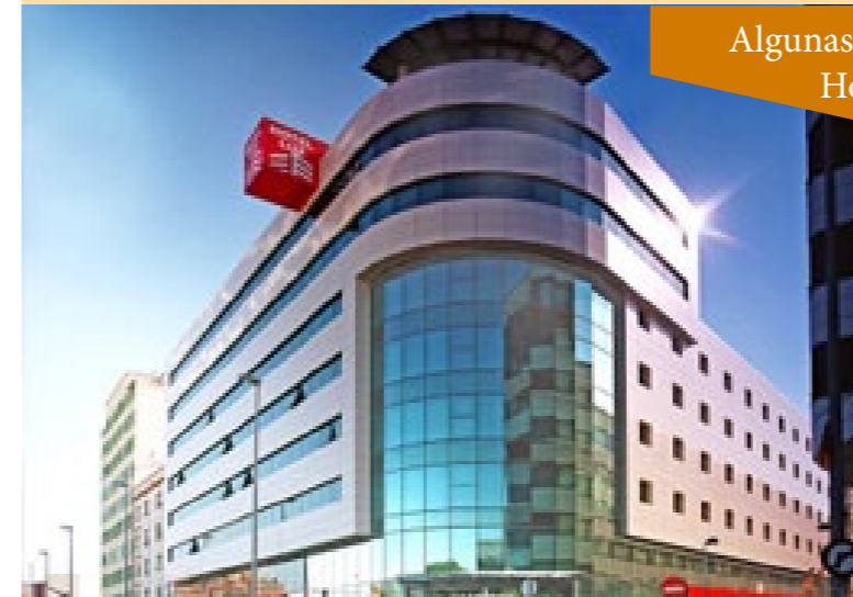
Algunas imágenes del Hotel Luz

Esperamos que esta iniciativa sea del agrado de todos los moteros que quieran visitar nuestra ciudad de camino a Cádiz. Además, cómo no, gozarán de una bienvenida especial en la sede de nuestro Club.