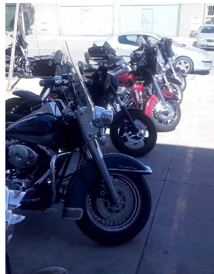
Después del Big Twin algunos aún nos fuimos a cenar a Les Canyes., y es que algunos nos cuesta decidir cuándo acaba la fiesta