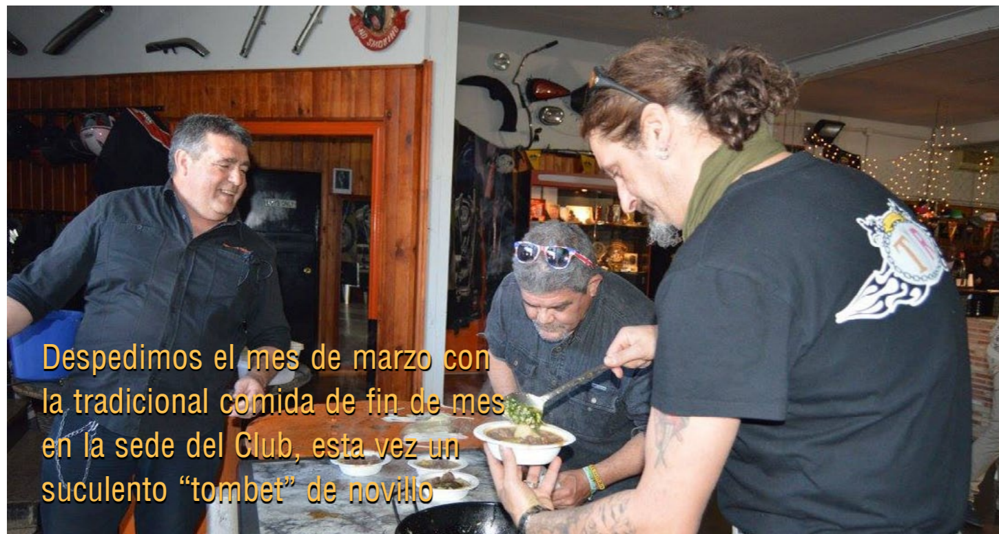
Despedimos el mes de marzo con la tradicional comida de fin de mes en la sede del Club, esta vez un succulento "tombet" de novillo