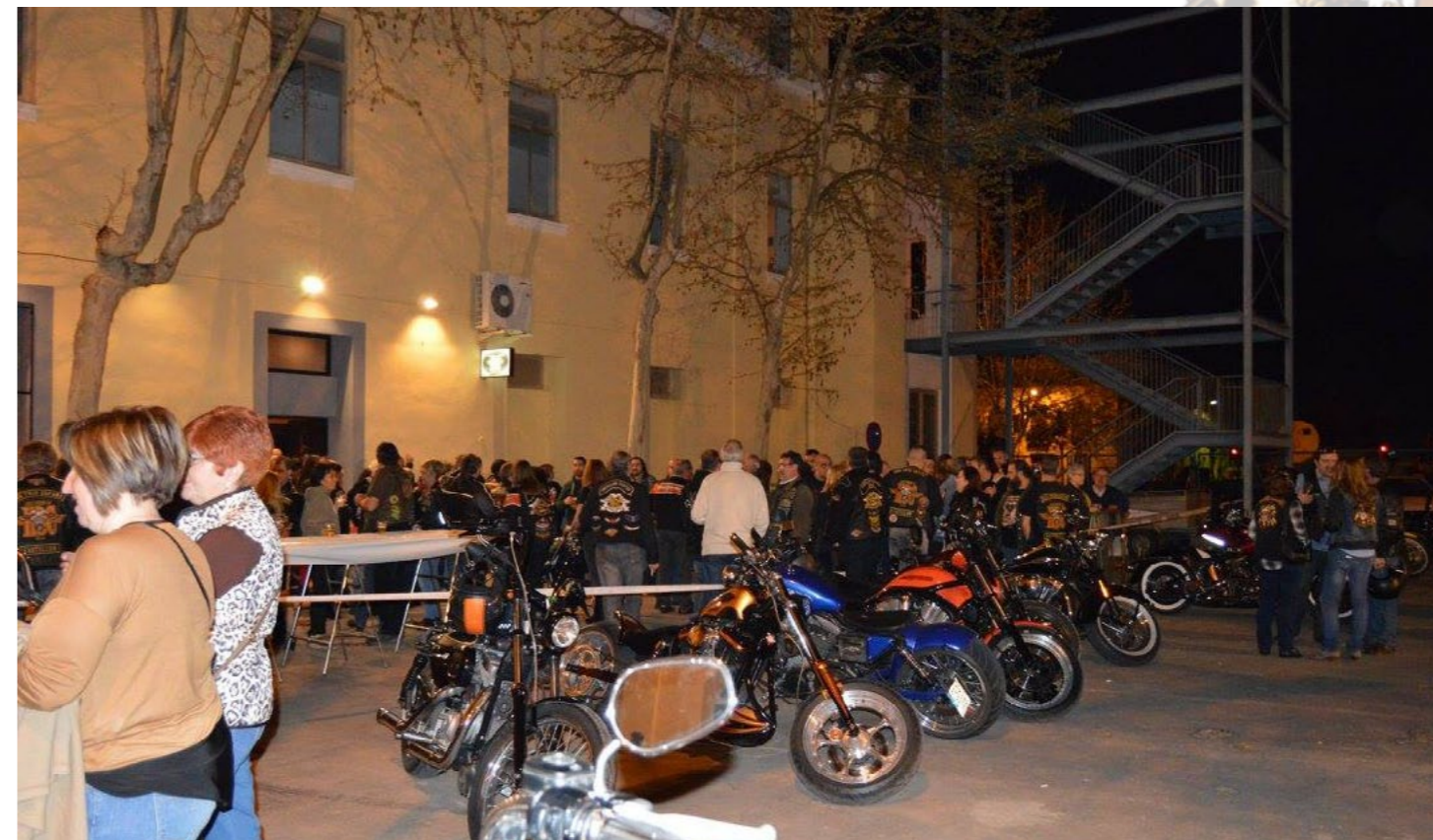
Y todavía nos quedaron ganas y energía para acabar la noche asistiendo a la inauguración del nuevo local de nuestros colegas del HDC Big Twin, donde nos juntamos un montón de gente para celebrarlo.